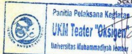
Hofifatus Zaina NRA WTO -8.15.10