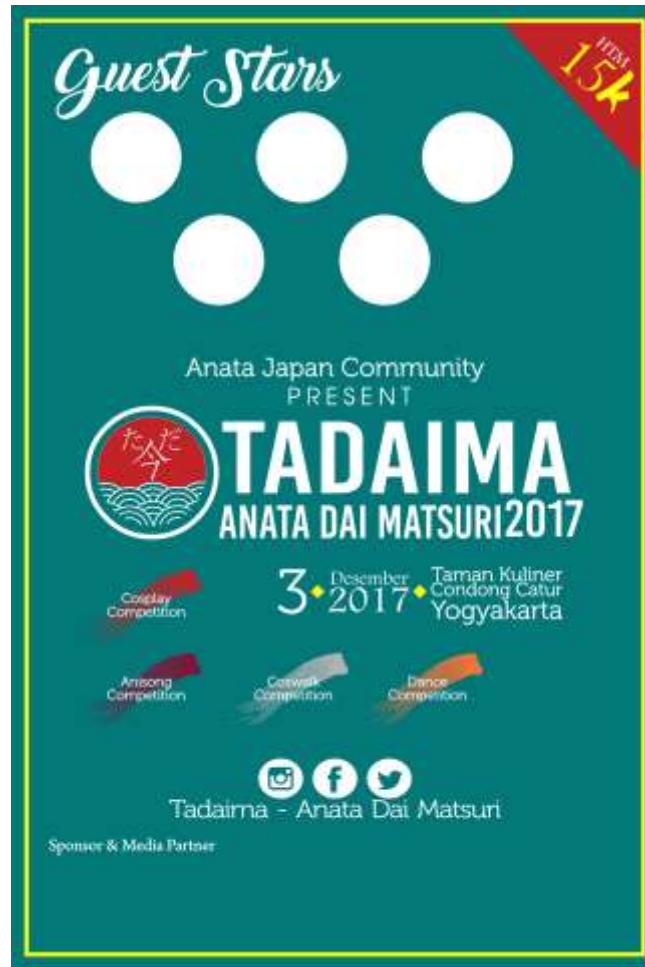
Gambar 5 Poster Tadaima! A3+

Jalan Raden Ronggo, Pojok Lapangan Karang, Kota Gede 083840338258, anataaimatsuri@gmail.com