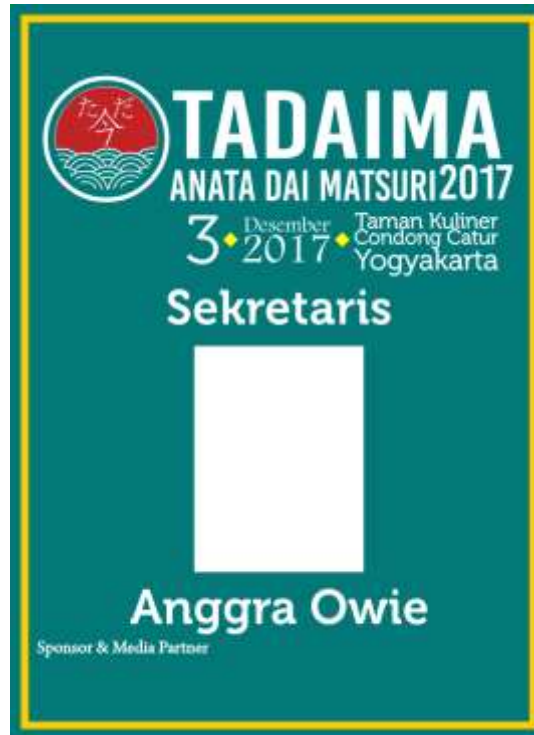
Gambar 3 COCARD PANITIA

Jalan Raden Ronggo, Pojok Lapangan Karang, Kota Gede 083840338258, anataaimatsuri@gmail.com