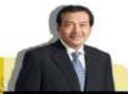
Mardiasmo WAKIL MENTERI KEUANGAN