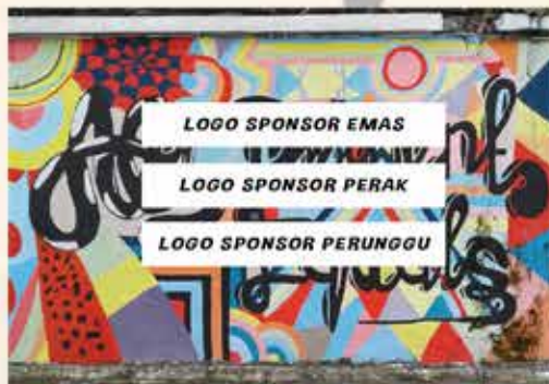
Logo pada tembok