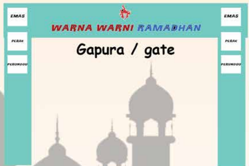
Gapura / gate