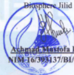
Achmad Mustofa Huda NIM 16/393137/BI/09557