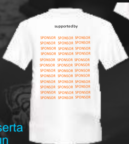
Baju peserta Fun run