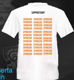
Baju peserta Fun run